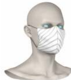
Schnitt Komfort mit Druck