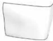
Einlagefach für austauschbare Filter