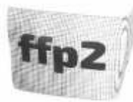
Filtereinlage ffp2 Standard