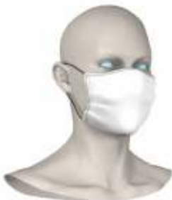
Schnitt Basic Quadratisch