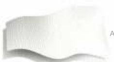
- Medizinisches Nonwoven Gewebe