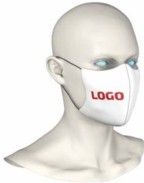
Ihr Logo / Ihr Design