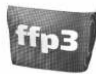
Filtereinlage ffp3 Standard